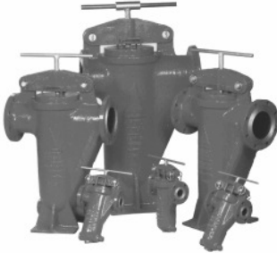
Bild 1 Einfachkorb-Filter